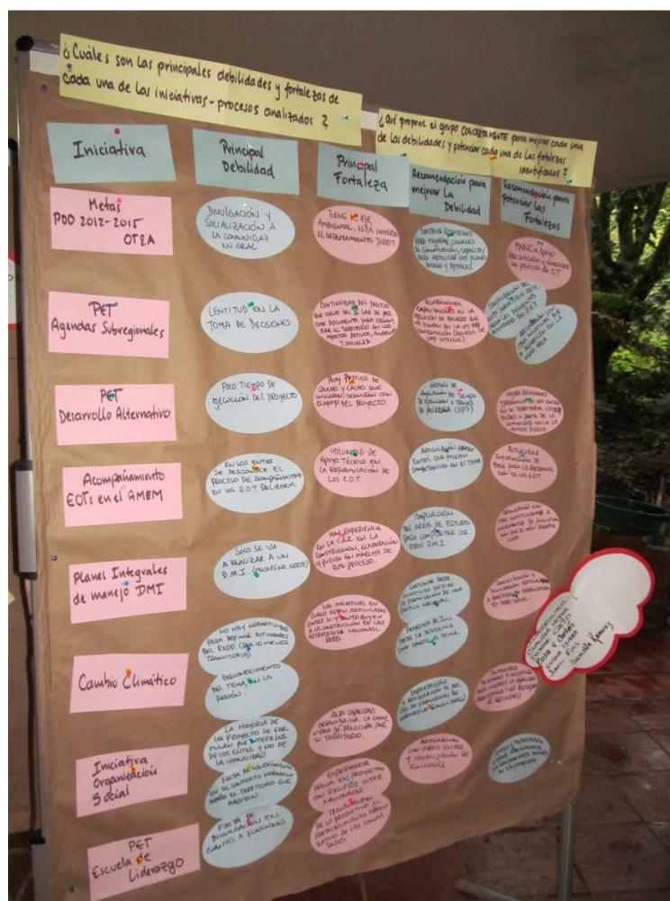
Transcripción del tablero: